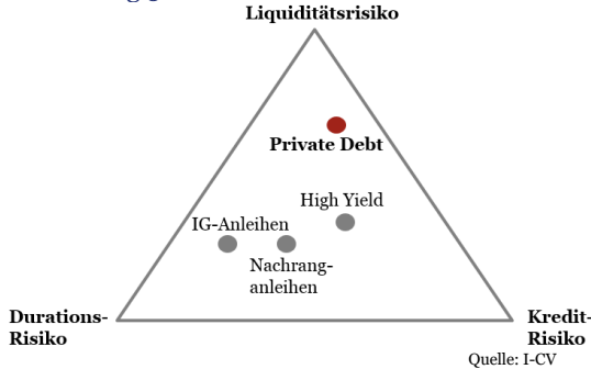
Abbildung 3: Trade-Off Risiken

Das Liquiditätsrisiko wird über eine messbare Illiquiditätsprämie abgegolten, während dem Kreditrisiko durch eine entsprechende Diversifikation sowie einer umfassende Kreditanalyse Rechnung getragen werden muss. Aufgrund der wirtschaftlichen Verwerfungen durch die Covid-19 Pandemie wird es in den nächsten Jahren zu einem starken Anstieg von Unternehmensinsolvenzen und Zahlungsausfällen kommen, weshalb sich eine enge und laufende Überwachung der Kreditrisiken stärker denn je aufdrängt. Die Durations-Risiken sind dank der üblicherweise variablen Verzinsung der Kredite tief (Inflationsschutz). Die Bonitätsprüfung, das Sourcing sowie die Kreditvergabe sind jedoch äusserst ressourcenintensiv (hohe Kosten). Eine direkte Kreditvergabe lohnt sich deshalb erst ab einem Investitionsvolumen von ca. EUR 10 Mio. Um ein einigermaßen diversifiziertes Portfolio aufzubauen, müssten daher mindestens EUR 300 Mio. investiert werden. Dies ist mitunter ein Grund, weshalb sich Investoren häufig für Fondslösungen entscheiden.